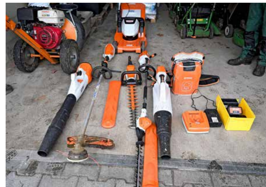
Westfalenfleiß hat Laubbläser, Heckenschere, Rasenmäher, Motorsense und Baumschere nach und nach durch akkubetriebene Geräte ausgetauscht.