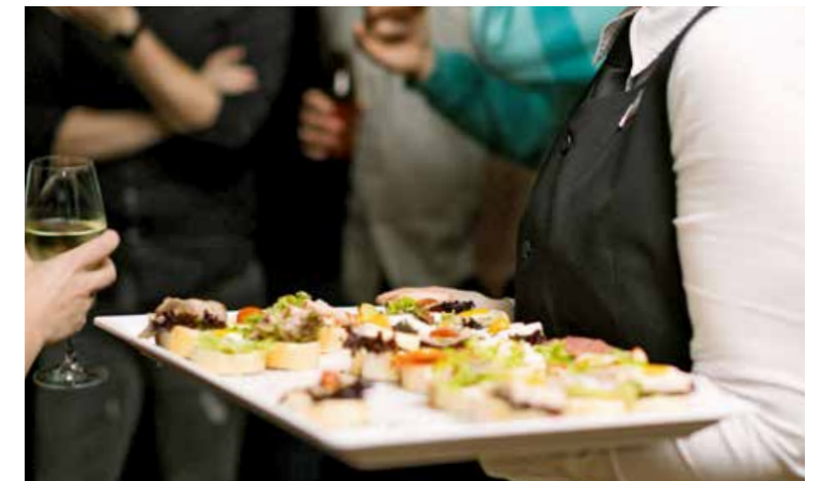
Wenn der Gast es nicht zum Büfett schafft, kommt das Büfett eben zum Gast.