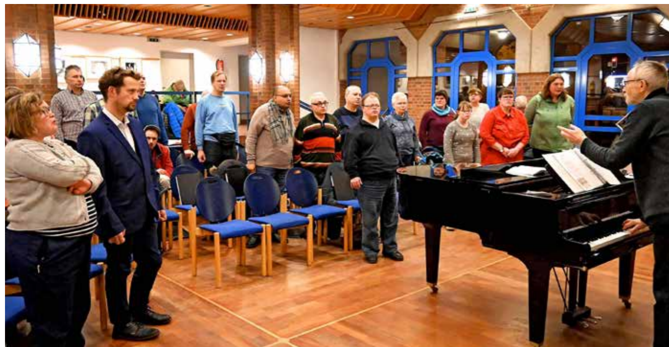
Abwechslung im Alltag bietet der Westfalenfleiß-Chor für die insgesamt rund 50 aktiven Mitglieder.