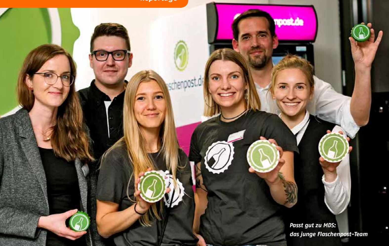
Passt gut zu MDS: das junge Flaschenpost-Team